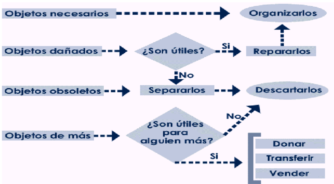
DIAGRAMA FLUJO PARA LA CLASIFICACION